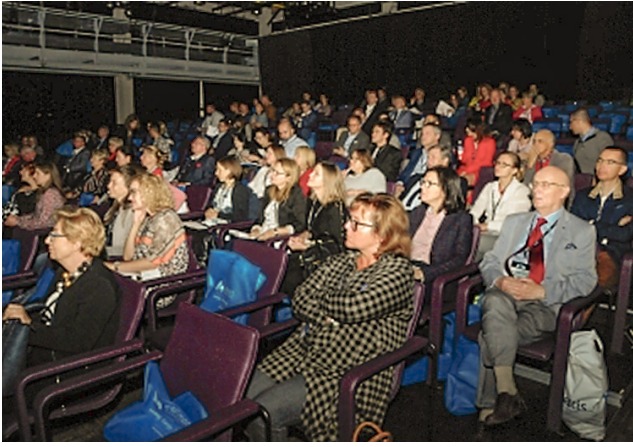
Konferencja PTA – 20. Dzień Andrologiczny, Lublin, 2018 r.