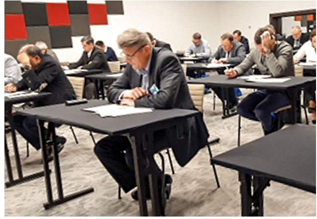
Egzamin do Certyfikatu z andrologii klinicznej. Konferencja PTA – 19. Dzień Andrologiczny, Kraków, 2017 r.

W grudniu 1994 r. PTA liczyło 190, a w grudniu 2019 r. – 258 członków zwyczajnych. Członkami PTA są lekarze, głównie o specjalizacjach ginekologia, endokrynologia, urologia, choroby wewnętrzne, a także diagnostyki laboratoryjnej, biolodzy, epidemiolodzy i lekarze weterynarii.