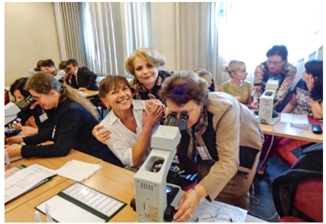
Kurs badania nasienia. Konferencja PTA – 15. Dzień Andrologiczny, Międzyzdroje, 2013 r.